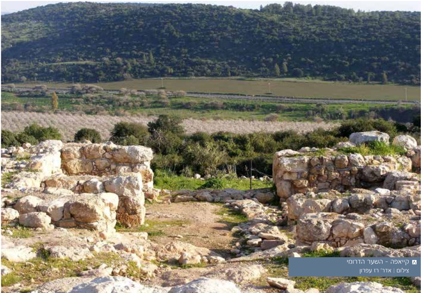
▲ קייאפה - השער הדרומי

תאפשר שמירה על עקרונות אלה, ולכן יש לבטלה.