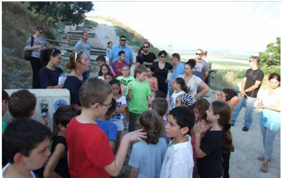
▲ פעילות יזומה של הורים וילדים בתל יקנעם.