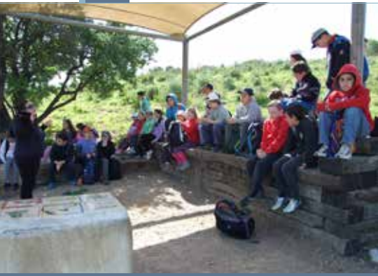
▲ מדריכי שבט הצופים מכירים את תל יקנעם ולומדים על האפשרויות לפעילות בו.

בעירייה כמו מחלקת הרווחה, הספרייה ועוד. שילוב זה הוביל לקשר עם קבוצת אזרחים ותיקים הפעילים ביישוב, שעתידה להפעיל את מרכז המבקרים בבסיס התל. תכניות לשילוב קהילה בתהליך שימור והגנה על מורשת תרבות, מובילות ליצירת גרעין קהילתי התומך בפעולות השימור ובכך ליצירת תמיכה ציבורית רחבה בו (McManamon & Hatton 2000). תכניות מסוג זה מצריכות זמן רב, שינוי דפוסי חשיבה וביסוס השינוי התודעתי המצופה מן הקהילה ומהרשות המקומית כלפי שימור המורשת המקומית כחלק מהתנהלותה בהווה ובעתיד. הרחבת המעורבות הקהילתית ממעגל בתי הספר למעגלי מעורבות אחרים בקהילה תוביל לזירוז התהליך, לביסוס ולחיזוק הקשר בין הקהילה למקום ולהפיכת המקום לחלק מחיי הקהילה.